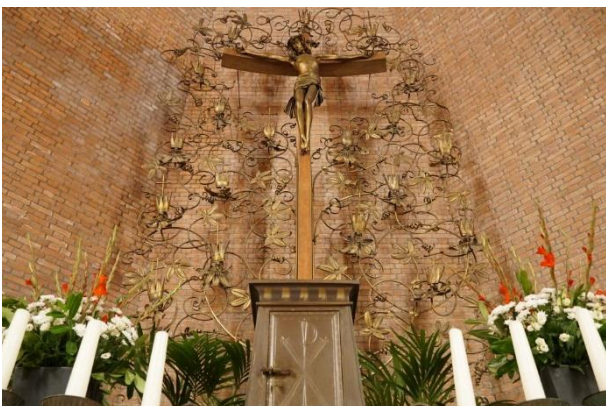
Tabernakel in de Bedevaartskerk in Brielle.