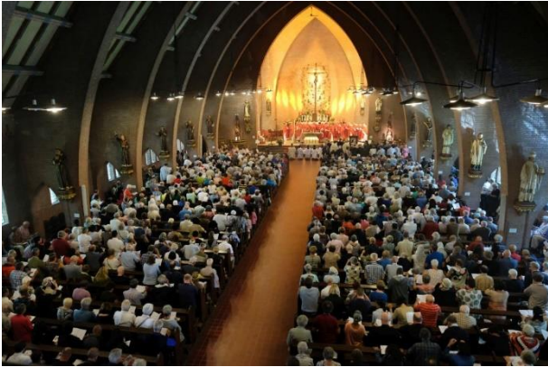
De Nationale Bedevaart in 2019.

Is de link verlopen? Stuur dan een mail naar persencommunicatie@bisdomrotterdam.nl