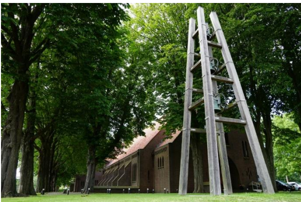
De Bedevaartskerk in Brielle met op de voorgrond de klokkenstoel.