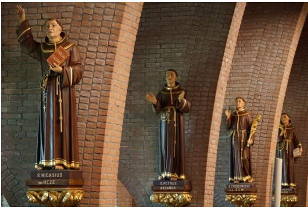
Bedevaardtskerk in Brielle.