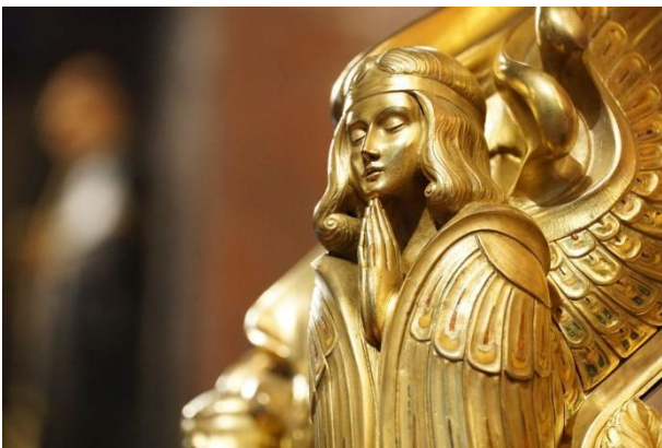
Reliekschrijn (detail) in de Bedevaartskerk in Brielle.