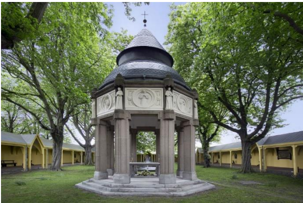
Ciborium op het Heiligdom in Brielle.