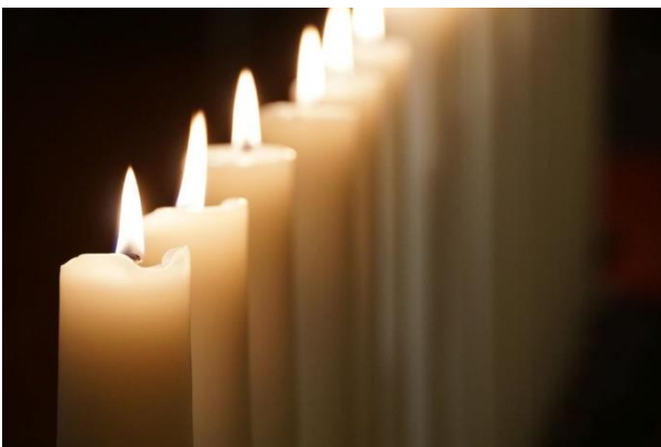
Voor de reliekschrijn in de Bedevaartskerk branden negentien kaarsen, voor elke martelaar één.