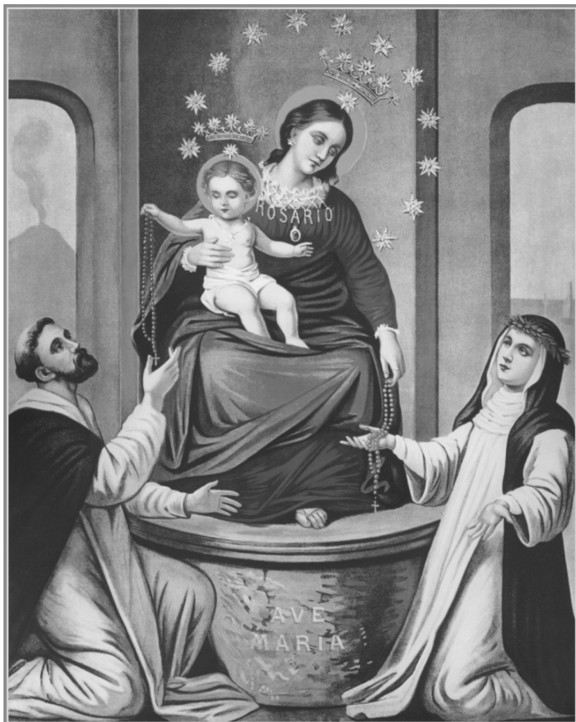
Onze Lieve Vrouw van de Rozenkrans. Zie pag. 8.