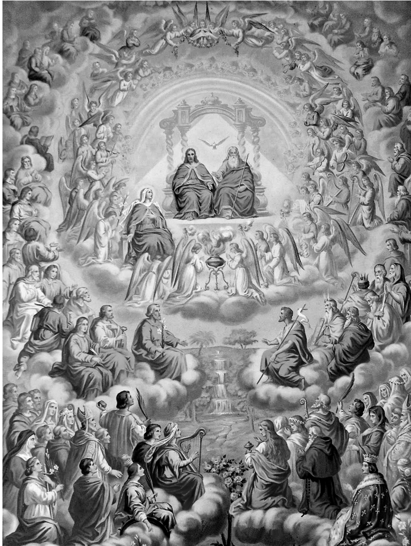
1 november, Allerheiligen.